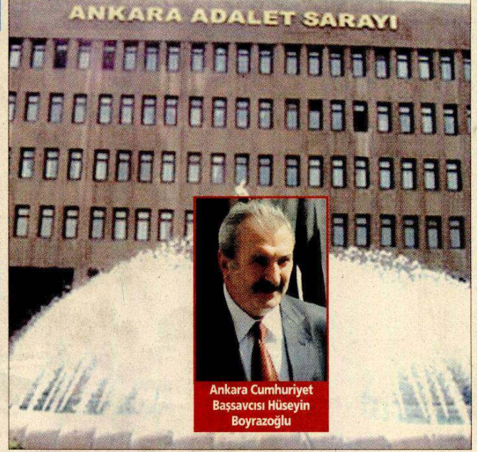
Ankara Cumhuriyet Başsavcısı Hüseyin Boyrazoğlu